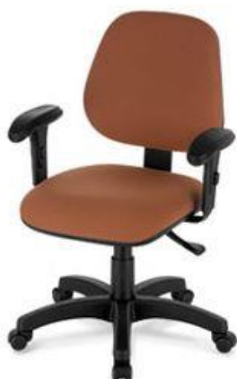
Referência: Poltrona Erme Flexform ou similar

Descrição: Poltrona giratória operacional com espaldar médio, com mecanismos de regulagem.