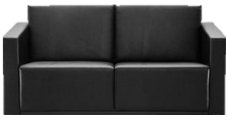
Referência: Sofá Alberflex ou similar

Descrição: Sofá de dois lugares com braços, padrão Executivo.