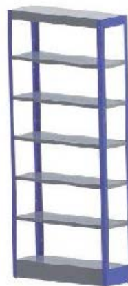
Referência: Estante de Aço Fenix Metalpox ou similar