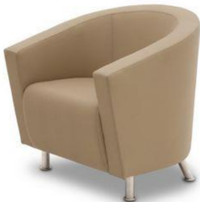
Referência: Poltrona Espera Clubchair Alberflex ou similar

Descrição: Poltrona de espera padrão Executivo, com apoio de braços.