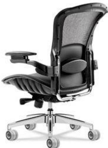
Referência: Poltrona Flextropic Flexform ou similar