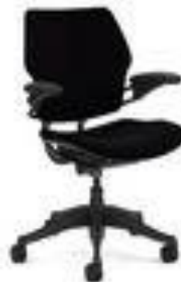
Referência: Poltrona Humanscale Alberflex ou Similar

ASSENTO – Moldado anatomicamente dentro das normas de ergonomia, para acompanhar o contorno do corpo e com bordas arredondadas para não impedir a circulação sanguínea do usuário. Estrutura em polipropileno OU em resina termoplástica injetada. Almofada em espuma de poliuretano OU espuma injetada flexível e tecido tipo tela OU vellum preto.