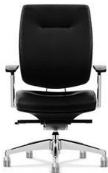
Referência: Poltrona Interlocutor Principessa Flexform ou similar