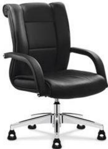
Referência: Poltrona Paris Flexform ou similar

Descrição: Poltrona de interlocução padrão Presidente com espaldar médio, com mecanismos de regulagem e braço fixo, compondo com a “Poltrona Giratória B”.