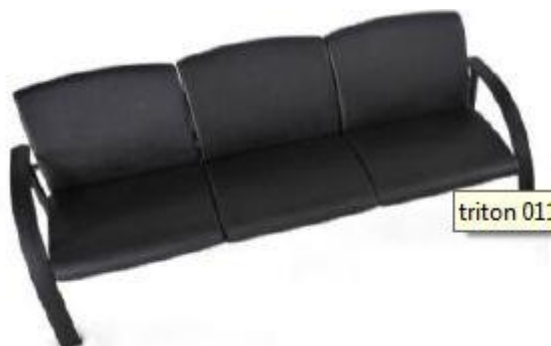
Referência: Poltrona Triton Chroma ou similar

Descrição: Poltrona de espera de três lugares com braços, padrão Executivo.