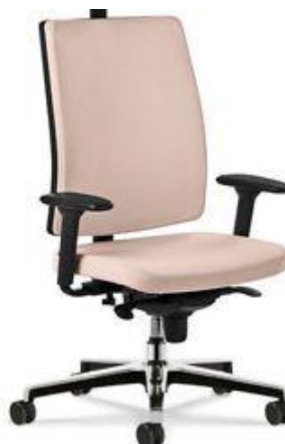
Referência: Poltrona LED Flexform ou similar

ASSENTO – Assento com chassis em concha única OU em concha bipartida de madeira multilaminada, moldada anatomicamente a quente OU em resina termoplástica/polipropileno injetada, moldados anatomicamente dentro das normas de ergonomia com bordas arredondadas para não impedir a circulação sanguínea do usuário. Almofada com, no mínimo 40 mm de espessura, produzida em espuma de poliuretano OU espuma injetada flexível com densidade entre 45 e 60 kg/m 3 revestida em couro ecológico. Cor a definir.