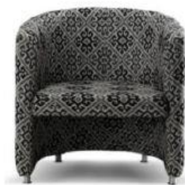
Referência: Poltrona Espera Focus Chroma ou similar

ESTRUTURA – Poltrona individual, com estrutura em madeira maciça de pinho tropical seco em estufa OU em aglomerado de no mínimo 18 mm OU alma interna totalmente em aço carbono SAE1010/1020. Fechamento lateral em papelão couro, OU estruturas laterais em aço com acabamento cromado.