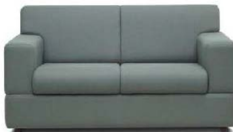
Referência: Sofá Axis Chroma ou similar

ESTRUTURA – Sofá de um lugar com braços e almofadas fixas. Estrutura interna em madeira com persintas de nylon OU alma em MDP OU madeira de reflorestamento.