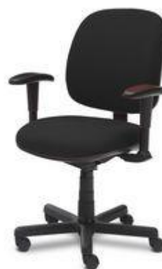
Referência: Poltrona 2000 Alberflex ou similar

ASSENTO E ENCOSTO – Fabricados em compensado anatômico moldado a quente, oriundo de madeira de reflorestamento ou de procedência legal, isento de rachaduras e deterioração por fungos ou insetos. Estofados com espuma de poliuretano injetado, de