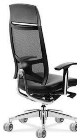
Referência: Poltrona Princesa Flexform ou similar

ASSENTO – Moldado anatomicamente dentro das normas de ergonomia, para acompanhar o contorno do corpo e com bordas arredondadas para não impedir a circulação sanguínea do usuário. Estrutura em polipropileno OU em resina termoplástica injetada. Almofada em espuma de poliuretano OU espuma injetada flexível com densidade entre 50 e 60kg/m 3 com espessura mínima de 40mm revestida em couro . Cor a definir.