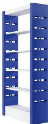
Referência: Estante de Aço Slit Biccateca ou similar

Descrição: Estante multiuso, fabricada em aço, para arquivo morto.