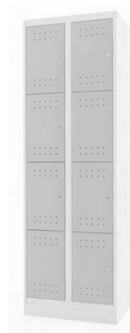
Referência: Guarda volumes Biccateca ou similar

ESTRUTURA - Armário Capacete Duplo com 08 (oito) portas, confeccionado em chapa de aço de baixo teor de carbono contendo: