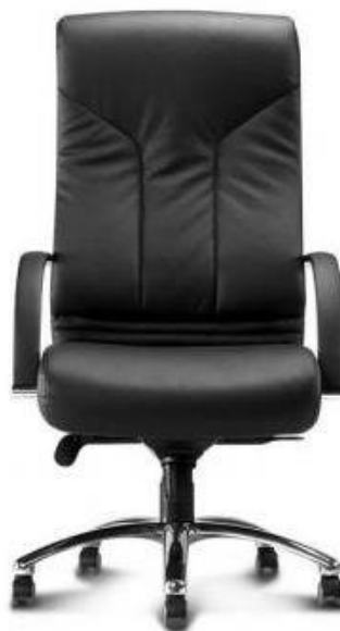
Referência: Poltrona Aquarius Chroma ou similar

ASSENTO E ENCOSTO – Em chassis de concha única OU tipo monobloco OU concha bipartida de madeira multilaminada com, no mínimo 12 mm de espessura OU polipropileno injetado. Moldado anatomicamente dentro das normas de ergonomia, para acompanhar o contorno do corpo e com bordas arredondadas para não impedir a circulação sanguínea do usuário. Almofada com, no mínimo 55 mm, produzida em espuma de poliuretano com densidade controlada entre 50 a 60 Kg/m 3 . A união do assento ao encosto quando em concha bipartida deverá ser em chapa de aço de no mínimo 65mm de largura e 5 mm de espessura. Revestida em couro natural preto.