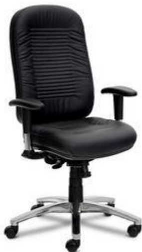
Referência: Poltrona Linha 2000 - 20PP3 Alberflex ou similar

Descrição: Poltrona padrão Executivo / Diretoria com espaldar alto, com mecanismos de regulagem.