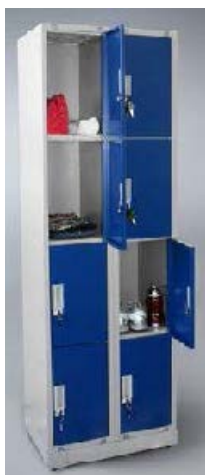
Referência: Guarda volumes Incam ou similar