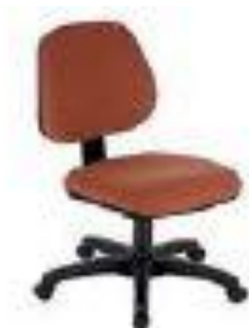
Referência: Poltrona Erme Flexform ou similar

Descrição: Poltrona giratória operacional com espaldar médio, com mecanismos de regulagem de altura, sem braço.