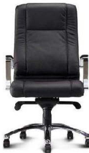
Referência: Poltrona Aquarius Slim Chroma ou similar

ASSENTO – Estrutura interna em madeira multilaminada OU polipropileno injetado, moldada anatomicamente a quente dentro das normas de ergonomia com bordas arredondadas para não impedir a circulação sanguínea do usuário. Almofada com, no mínimo 40 mm de espessura, produzida em espuma de poliuretano com densidade entre 50 e 60 kg/m 3 . Almofada revestida em couro ecológico com costuras. Cor a definir. A fixação do assento à base da cadeira deverá ser feita através de “rebite tubo ferro zincado” cravados na madeira compensada passante de um lado para outro do mesmo,