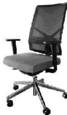
Referência: Poltrona Interlocutor Play Alberflex ou similar

ASSENTO – Moldado anatomicamente dentro das normas de ergonomia, para acompanhar o contorno do corpo e com bordas arredondadas para não impedir a circulação sanguínea do usuário. Estrutura em polipropileno OU em resina termoplástica injetada. Almofada em espuma de poliuretano OU espuma injetada flexível com densidade entre 50 e 60kg/m 3 revestida em couro. Cor a definir.