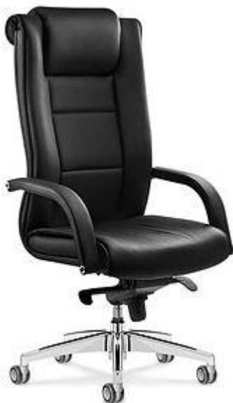
Referência: Poltrona Paris Flexform ou similar