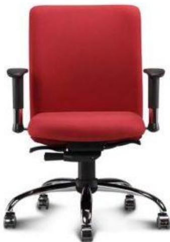
Referência: Poltrona Titânia Chroma ou similar