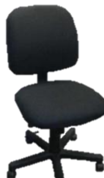
Referência: Poltrona 2000 Alberflex ou similar

ASSENTO E ENCOSTO – Fabricados em compensado anatômico moldado a quente, oriundo de madeira de reflorestamento ou de procedência legal, isento de rachaduras e deterioração por fungos ou insetos. Estofados com espuma de poliuretano injetado, de