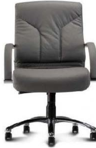
Referência: Poltrona Aquarius Chroma ou similar

ASSENTO E ENCOSTO – Em chassis de concha única OU tipo monobloco OU concha bipartida de madeira multilaminada com, no mínimo 12 mm de espessura OU polipropileno injetado. Moldado anatomicamente dentro das normas de ergonomia, para acompanhar o contorno do corpo e com bordas arredondadas para não impedir a circulação sanguínea do usuário. Almofada com, no mínimo 45 mm, produzida em espuma de poliuretano com densidade controlada entre 50 a 60 Kg/m 3 . A união do assento ao encosto quando em concha bipartida deverá ser em chapa de aço de no mínimo 65mm de largura e 5 mm de espessura. Revestida em couro natural preto.