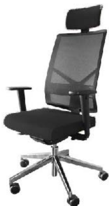
Referência: Poltrona Play Alberflex ou similar

Descrição: Poltrona padrão Presidente com espaldar alto e encosto de cabeça, com mecanismos de regulagem.