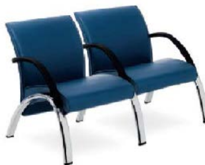
Referência: Poltrona 3 lugares Páfia Flexform ou similar

ASSENTO E ENCOSTO - Assento em madeira multilaminada, moldada anatomicamente a quente OU em polipropileno injetado de alta resistência moldados anatomicamente dentro das normas de ergonomia com bordas arredondadas para não impedir a circulação sanguínea do usuário. Encosto com alma de chassi metálico, confeccionada em tubos de aço. Assento e encosto de espuma de poliuretano injetado com densidade de 50 a 55 kg/m 3 . A estrutura deverá ser resistente, de acordo com normas da ABNT.