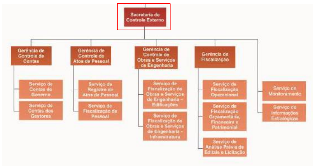
Figura 1. Organograma da área

A figura 1 apresenta o organograma da unidade organizacional, cuja inspeção tem como foco o quantitativo de processos (unidade organizacional em vermelho).